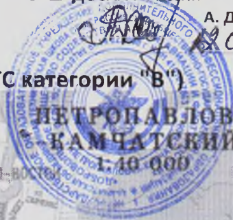
СХЕМА УЧЕБНОГО МАРШРУТА №2 (ТС категории "В")